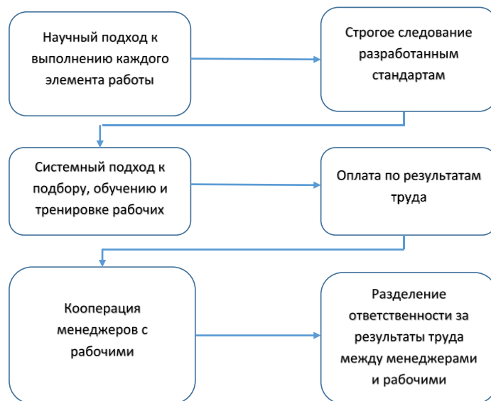
Рис. 1. Условия эффективного управления по Ф.Тейлору

Основная ценность научных подходов в организации труда по Тейлору заключается в достижении максимальных результатов в производстве с наименьшими трудовыми, материальными, топливно-энергетическими, финансовыми и иными ресурсами [1]. Это достижимо при рационализации производства и эффективном использовании всех составляющих процесса производства от машин и оборудования до производственных площадей.