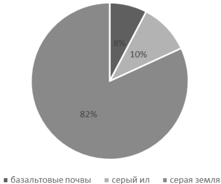
Рис.2. Виды почв под производственным лесом в провинции Донгнай

На юго-востоке Вьетнама местность относительно плоская (плато), что обуславливает посадку на такой местности чистых видов акаций и акаций смешанных видов. В провинции Донгнай группа почв представлена серым илом, базальтовыми почвами, серой землей (рисунок 2).